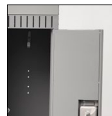
Portes à panneaux doubles, extérieur de calibre 20 et intérieur de calibre 24 (casiers de un et deux niveaux)