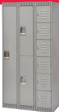
Cadres de calibre 16, corps et tablettes de calibre 24