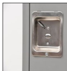
Poignées pour cadenas en retrait, en acier inoxydable Loquet magnétique assurant une fixation solide de la porte lorsque fermée