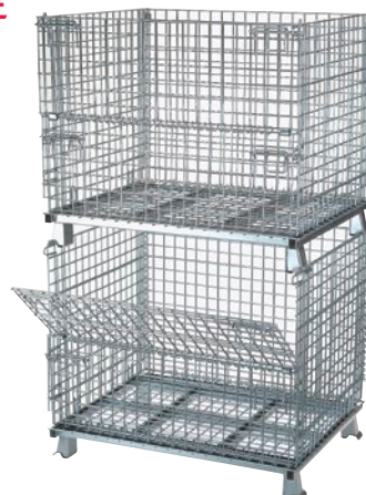
Montré avec 2 unités empilées