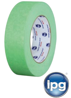
Prix par rouleau