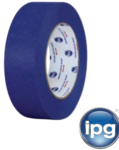
Prix par rouleau